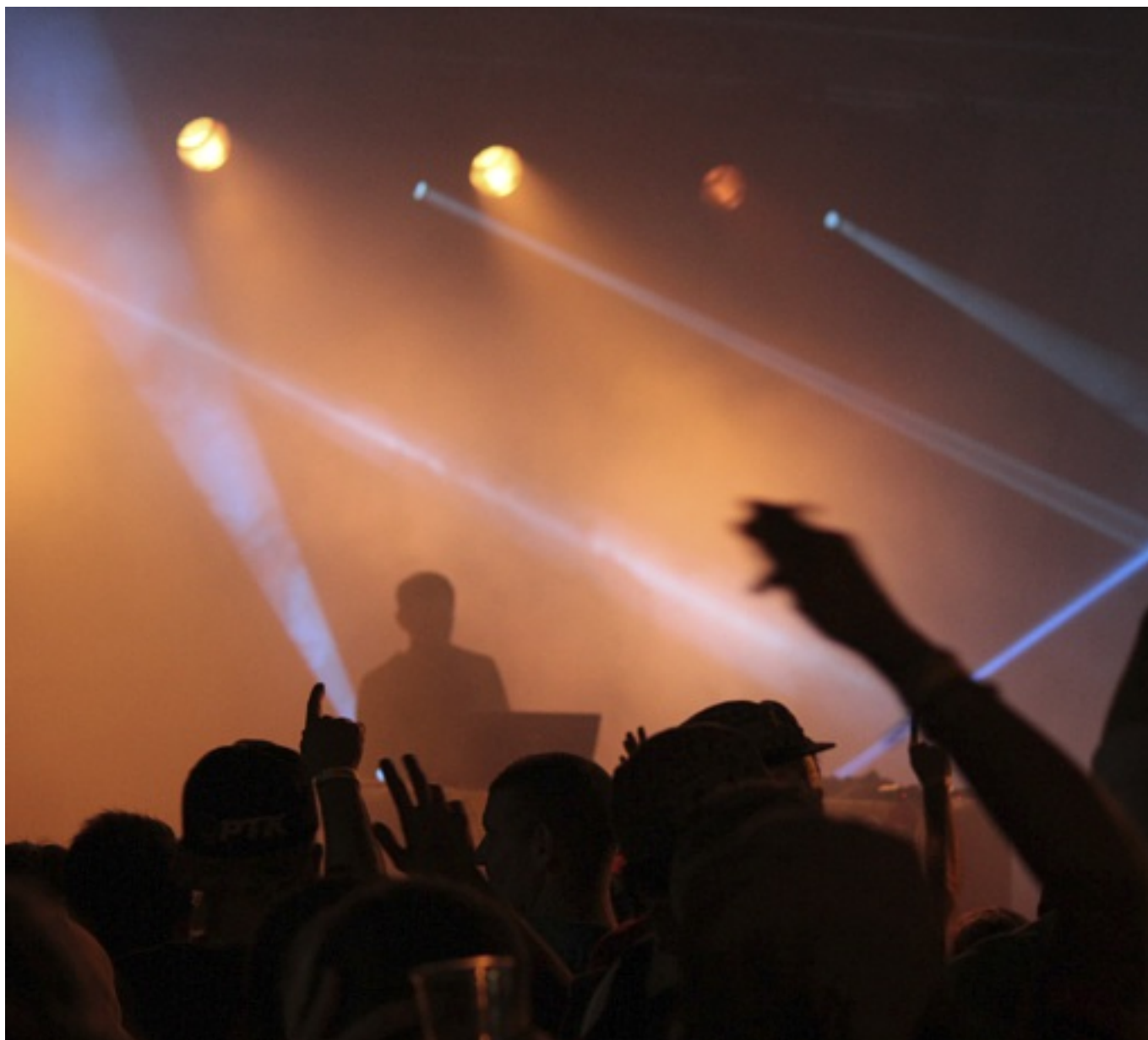
Edition de 2015 avec Noisebuilder