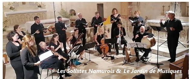
Les Solistes Namurois & Le Jardin de Musiques

Cantates pour alto et cordes de Vivaldi ( Nisi Dominus ), Pergolesi ( Salve Regina ), Scarlatti, Stradella ... Le Jardin de Musiques